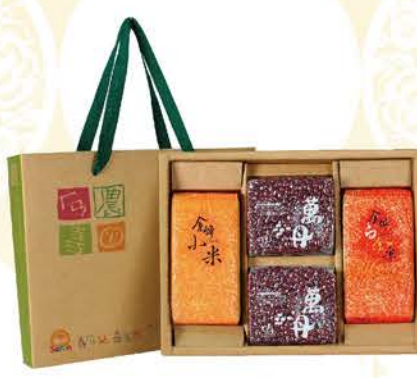
山海相思戀 | D nt.520