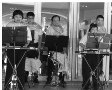
1.音樂活動 2.樂活香草 3.口腔照護 4.端午包粽