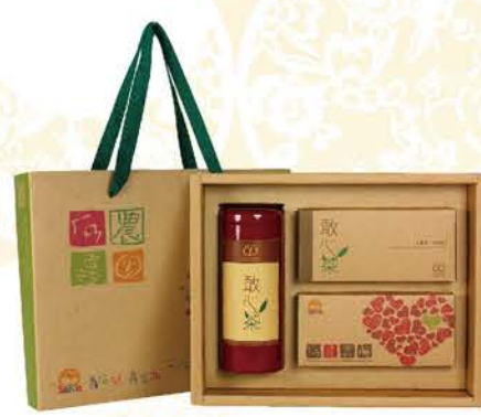
敢心茶 | E nt.450