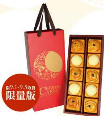
喜悅圓滿 | C 系列 C1 nt.580