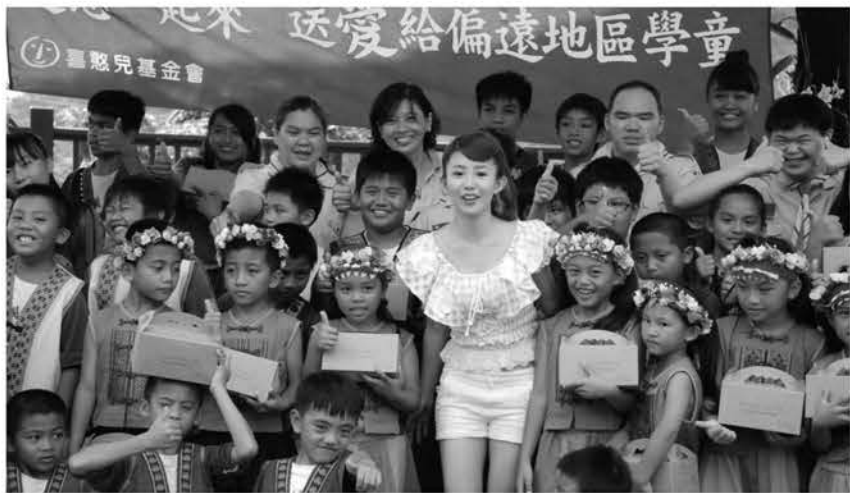
▲ 瑤瑤姐姐親訪青山國小送愛

www.c-are-us.org.tw 07-7266096 02-23455812 03-6563638