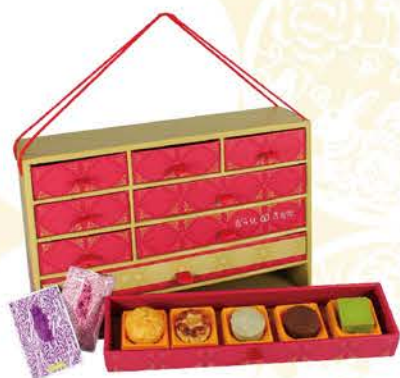
豐華多寶格 | A 系列 A1/A2 nt.1280

限量手工生產，值得典藏的中秋禮盒，品味傳統的懷念滋味 www.careus.org.tw 立即線上訂購