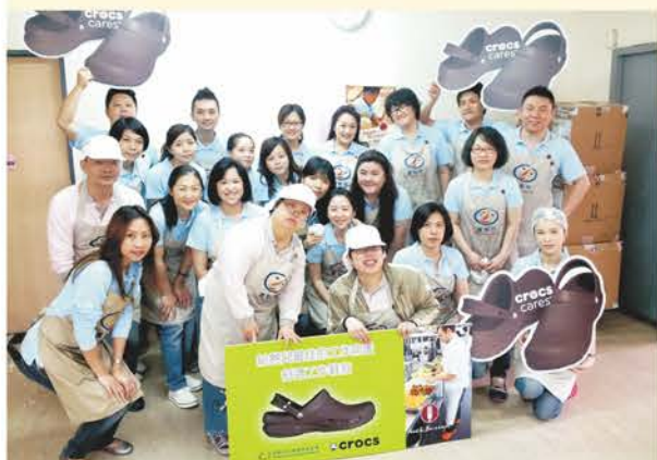
▲ crocs團隊來到底護工場進行志工服務

本屆研討會共有 200多位產官學界代表與會，主要聚焦於國內外的理論及實務經驗，包括英國Simon Teasdale教授發表其最新研究『緊張關係之協調：英國如何整合社會企業在社會和商業考量間的平衡』。日本Hajime Imamura教授，也分享人力資源與社會網絡對社會企業運作之影響。香港新生精神康復會游秀慧執行長，說明康復會在社會企業之品牌，發展歷程及成功關鍵因素。