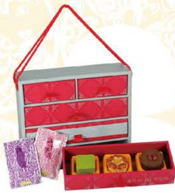
璀璨多寶格 | B 系列 B1/B2/B3 nt.780