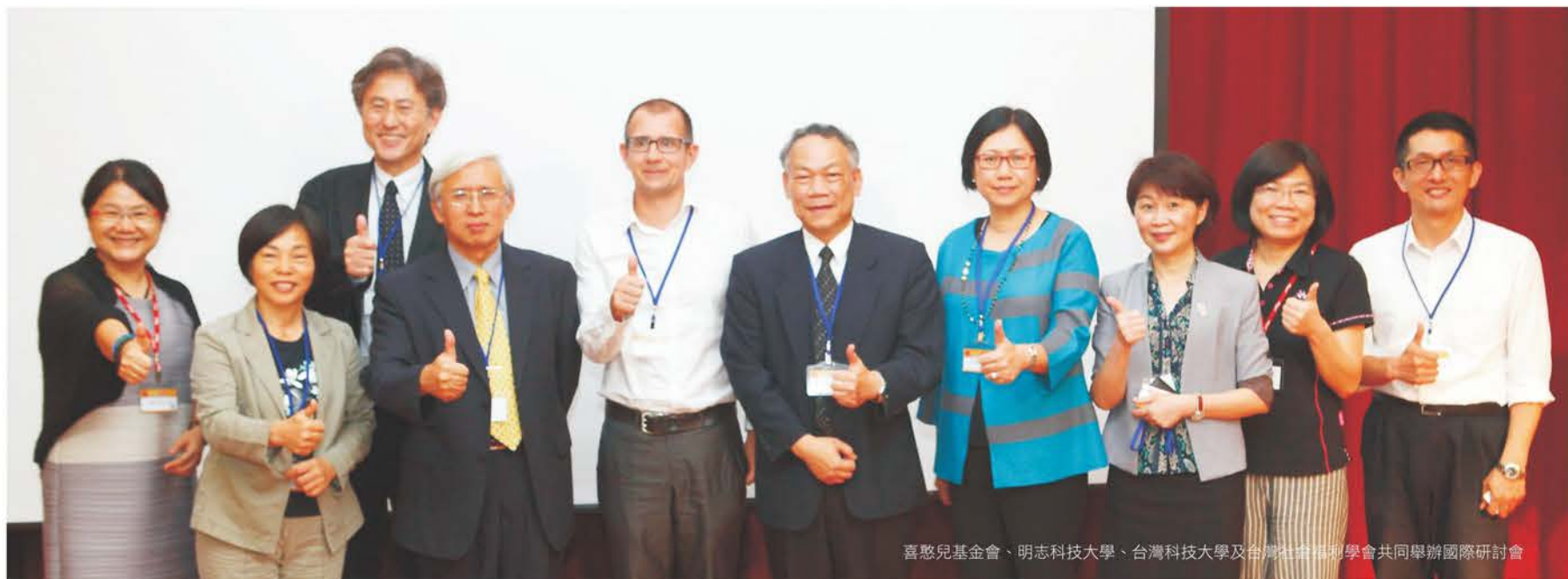
喜憨兒基金會、明志科技大學、台灣科技大學及台灣社會福利學會共同舉辦國際研討會