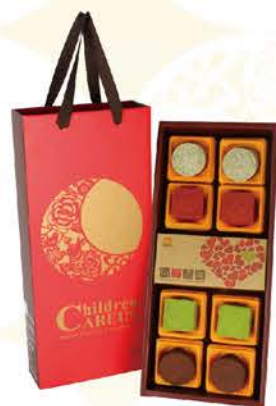
喜悅友愛 | C 系列 C2 nt.450