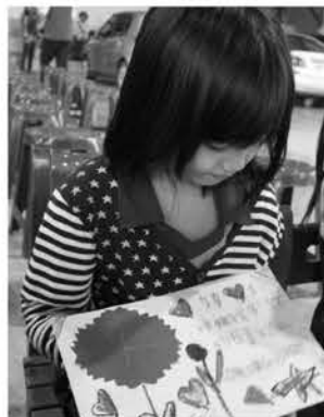
▲ 學童畫卡片表示感謝

謝謝孩子們喜歡喜憨兒哥哥、姐姐製作的美味，謝謝你們長得頭好壯壯，謝謝每一位曾經參與或即將參與的朋友…。送愛到部落對喜憨兒而言，是靠雙手反哺社會，更是獲得肯定的機會，從中累積自立的明天。一張張純真、稚嫩的笑臉就是送愛旅程中豐盛、無價的收穫，我們會好好的…穩穩的將每一次相處回憶深刻保存，從中累積下次再見的動力。