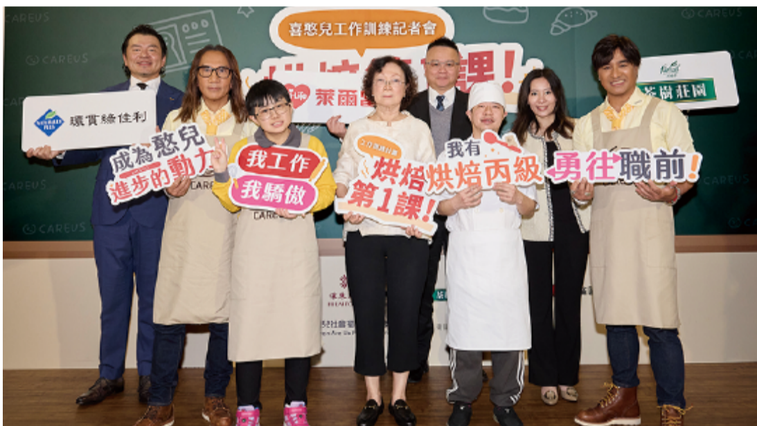
動火車二度代言喜憨兒基金會公益計畫

【文/公益行銷部 整理】喜憨兒基金會1997年成立第一間烘焙坊，幫助心智障礙者成功就業，現今已於全台設立17處庇護職場，一年提供近千位心智障礙者庇護性與支持性就業服務；自2011年成立丙級考照班，至今喜憨兒已取得153張門市服務、烘焙、中西餐