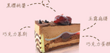
巧克力慕思蛋糕 8吋 / NT$750 Chocolate Cake & Strawberry Mousse

濃得化不開的，是母親的愛，還有釀漬黑櫻桃醬與巧克力慕斯的絕妙融合，香甜不甜膩的精緻搭配，給媽媽五星級法式甜點的高級享受。