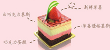
草莓優格蛋糕 12x12cm / NT$560 Chocolate Cake & Strawberry Mousse

手工自製的優格內餡，香甜甜蜜令人驚喜，新鮮草莓與特選果泥美味加乘，獻上大大的擁抱，感謝媽咪的辛勞。